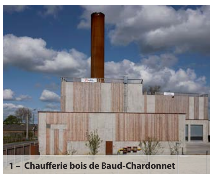
1 – Chaufferie bois de Baud-Chardonnet

Depuis 2010, à la demande de Rennes Métropole, les bailleurs sociaux étudient systématiquement un scénario de rénovation basse consommation, ce qui a permis une montée en performance progressive des rénovations énergétiques. Pour le parc privé, Rennes Métropole pilote la plateforme écoTravo d'appui aux propriétaires animée par l'ALEC et l'ADIL. Les copropriétés sont accompagnées par la SPL d'aménagement Territoires Publics.