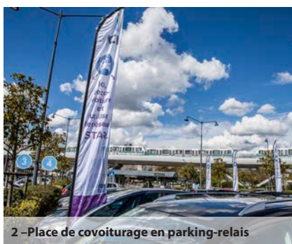
2 – Place de covoiturage en parking-relais