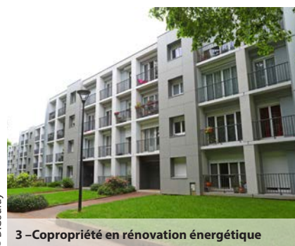
3 – Copropriété en rénovation énergétique