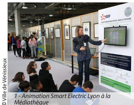
1 - Animation Smart Electric Lyon à la Médiathèque

Dans le cadre du dispositif Familles à Energie Positive, la Ville a missionné l'Agence Locale de l'Energie et du Climat (ALEC) de Lyon pour un accompagnement ciblé de familles vivant dans des collectifs raccordés au réseau de chaleur. Une vingtaine de personnes de 2 copropriétés ont ainsi pu bénéficier d'informations sur le réseau de chaleur, les consommations énergétiques et les éco-gestes.