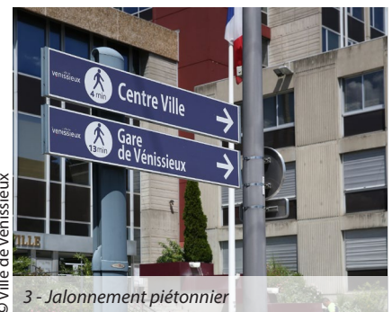
3 - Jalonnement piétonnier