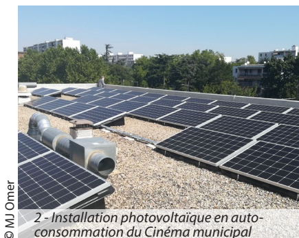
2 - Installation photovoltaïque en auto-consommation du Cinéma municipal