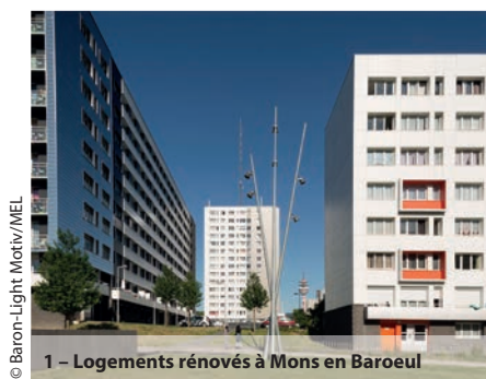
1 - Logements rénovés à Mons en Baroeul

Création d'un dispositif de Conseil en Énergie Partagé : en 2017, la MEL a créé 3 postes de conseiller en énergie partagé. Ils accompagnent 23 communes de moins de 15 000 habitants pour la mise en place d'un suivi des consommations d'énergie et de plans d'actions visant à réduire ces consommations ou à produire des énergies renouvelables.