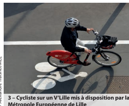
3 - Cycliste sur un V'Lille mis à disposition par la Métropole Européenne de Lille