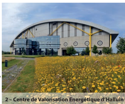
2 - Centre de Valorisation Énergétique d'Halluin