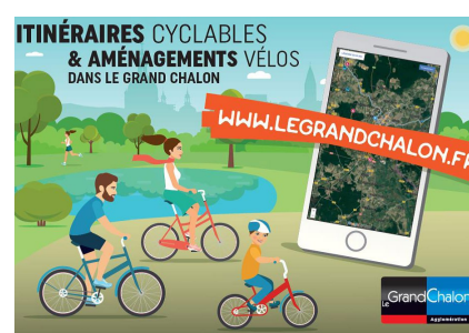
3 - Flyer itinéraires cyclables