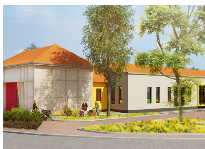
2 - EMA Sainte Marie